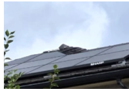
施工：モットーキュー(株)

子どもが小さいので夏場はエアコンをつけっぱなしにも関わらず、電気代を抑えられました。