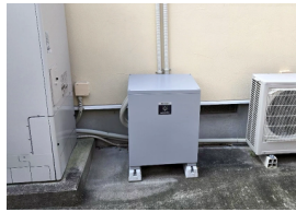
施工：モットーキュー(株)

4.3kWの太陽光を設置しFIT制度を活用して10年間売電していましたが、FIT終了後は売電価格が下がるので、蓄電池の導入を検討していました。