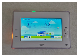
施工：デンキカン泉

光熱費が高騰する中、電気は「買う」時代から「自分で作る」時代に転換していると思い、導入を決めました。